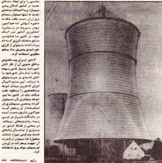
با بانک شرکت آمریکایی شیک‌اگرن نیروگاه در بحر آورد در نظیر گسوفته شده در مقابل زلزلی بنا شد